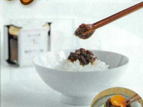
メディアも注目!累計販売本数450万本突破、牛タン山台ラー油。

商品番号 I395-265-071 牛タン山台ラー油詰合せ 3,996円 (税抜価格3,700円)