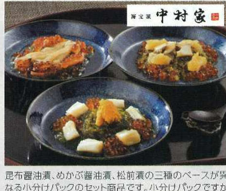
昆布醤油漬、めかぶ醤油漬、松前漬の三種のベースが異なる小分けパックのセット商品です。小分けパックですから自由にお召し上がりいただけます。素材に、味にこだわった品々を見非ご堪能ください。

■商品内容:250g ■賞味期限:冷凍180日 (出荷期間:6月初旬~8月末) アレルギーマッチを含む特定原材料(8品目) 冷蔵