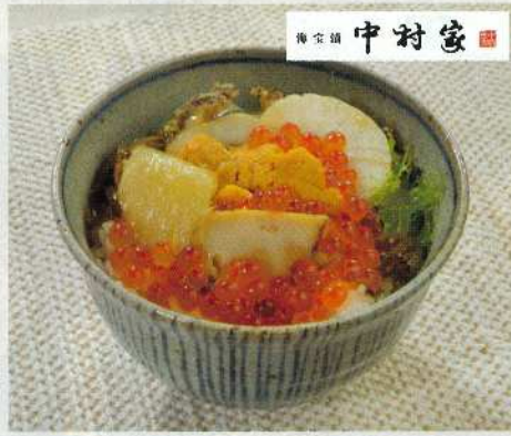
三陸産めかぶ醤油漬をベースに、いくら・あわび・うに・はたて・数の子をトッピングした豪華海鮮漬。

■商品内容:牛タン山台ラー油(100g)×3 ■賞味期限:常温240日 アレルギーマッチを含む特定原材料(8品目) 常温