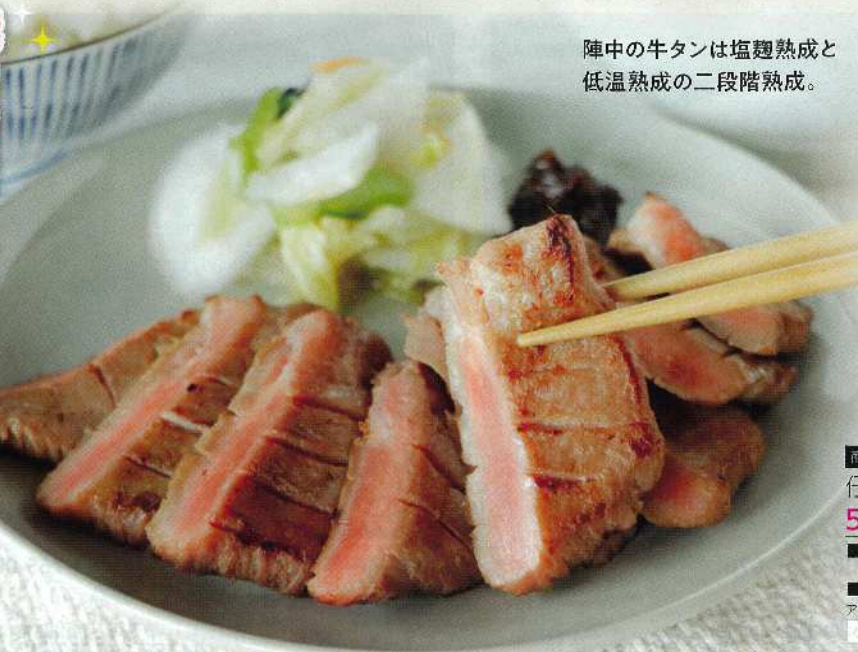
陣中の牛タンは塩麴熟成と低温熟成の二段階熟成。