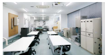
ほっとラボ横浜レクチャールーム (講習室)

「リンナイでは全国の支店に『ほっとラボ』を併設しています。最新商品を体験いただけるほか、施工実習やセミナーのための講習室もあります。ぜひ、ご予約をお待ちしております」