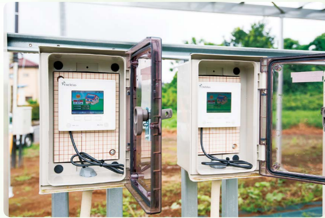
発電量はモニターにより、リアルタイムで確認できる