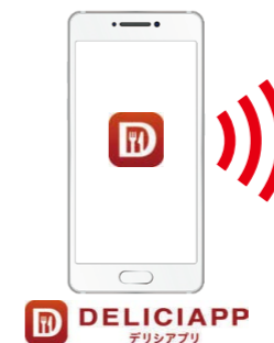
DELICIA APP デリシアアプリ