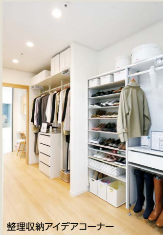
整理収納アイデアコーナー