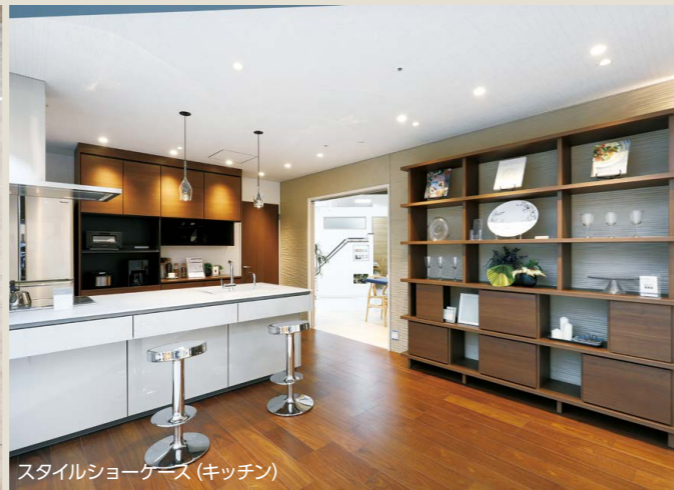
スタイルショーケース (キッチン)