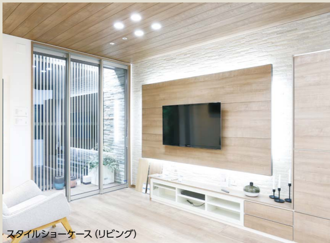
スタイルショーケース (リビング)