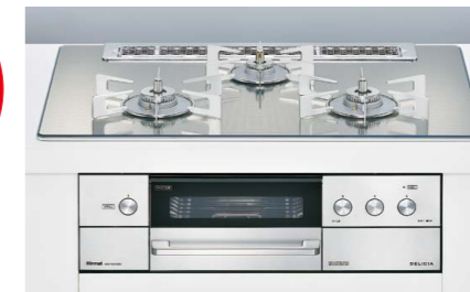
DELICIA 3V 乾電池タイプ (操作部液晶タイプ)