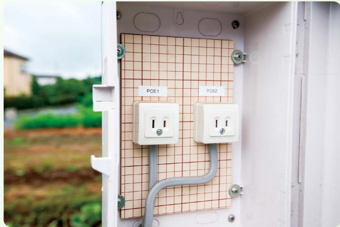
営農の際に、発電した電気を使用することもできる