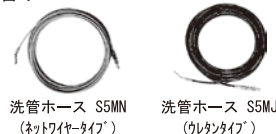
洗管ホース S5MN (ネットワイヤータイプ) 洗管ホース S5MJ (ウレタンタイプ)