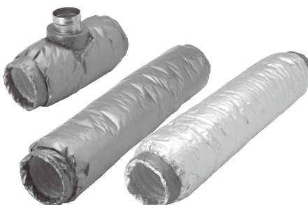
フジレックス (INタイプ/IPタイプ) スーパーフジレックス (INタイプ/IPタイプ)

※金属フレキは、平成12年建設省告示第1400号で定められた不燃材料に該当いたします。