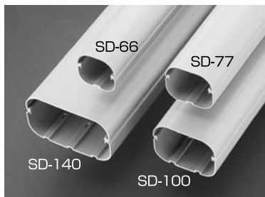
サイズバリエーション▶