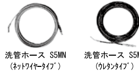
洗管ホース S5MN (ネットワイヤータイプ)