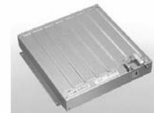
FGS型厨房用防火シャッター