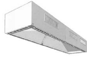
給排気一体型フード

※各種排気フード及びウェザーカバー・フィルターボックス・給気チャンバー等設計製作致します。