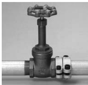
鋼管マルチ継手型

種類 鋼管マルチ継手型・鋼管兼用型・鋼管直管専用型・銅管兼用型・銅管直管専用型・塩ビ管兼用型