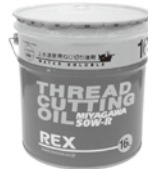
上水道用ミヤガワ50W-R 日本水道協会規格品 (JWWA K-137)