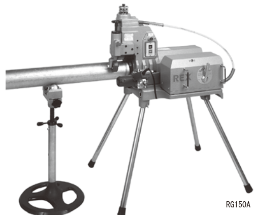
※標準付属品のパイプ受台をご使用ください。

標準仕様は角溝ですが、オプションでU溝対応可。その他にも25~40A、200~300A、薄肉ステン管にもオプションで対応。詳しくはお問い合わせください。