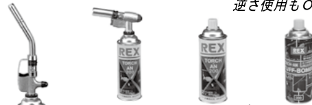
トーチ・アン トーチ・アン・ガス トーチ・アン・タフボンベ