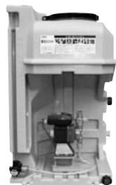
AP-10BD 型 流量比例滅菌可能