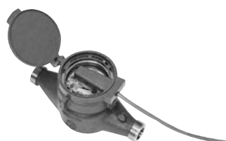
15LN ~ 50VWK 型