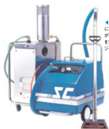
◀エベレストを日本の市場用に小型化し、トラックマウントが必要のない小規模の清掃を実現した「スチームクレンジャー」