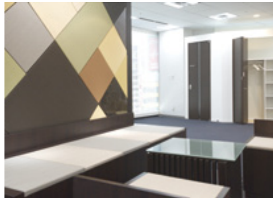
▲汚れに強く、日焼けしにくい和紙を素材にした新しい畳のある住まいの空間を提案する「なごやか団楽」コーナー