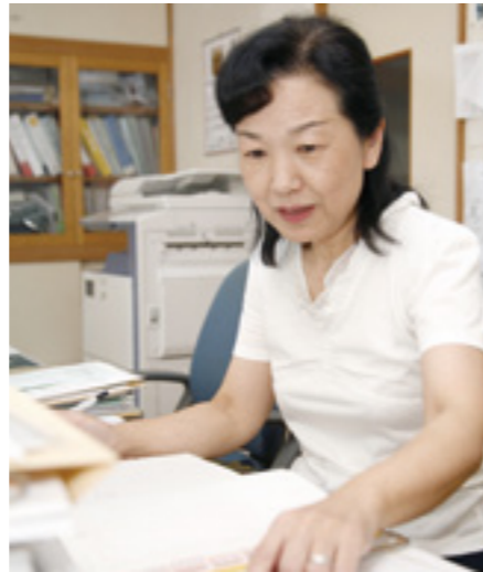
▲一般のお客様の関心も高いエコキュート。近ごろはインターネットの普及により、お客様も詳しい情報を入手しやすくなっている、とか