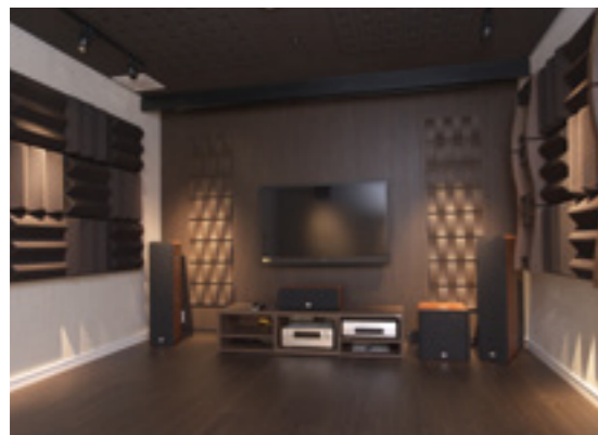
▲大画面テレビの迫力ある映像を楽しみながら、映画館にいるような音響効果を実感できたり、防音や遮音効果なども体験できる「防音ルーム」

「今、家を建てる人は、素材もすべて自分の目で確かめる。メーカーなどインターネットで検索して他社と比べて検討されます。すべてふるいにかけられて、残った方が我々の所に来られるわけです。ショールームには求められているものがあり、実際の機能なども実験できる場ではなくてはならない。ですから、何事も体感して納得していただくということに、重点を置きました」 体感して納得していただく ここから、家づくりがスタートする 体験コーナーは、「エコ素材」コーナ