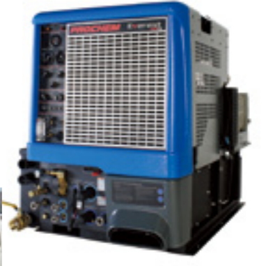
◀自らの装置で温水をつくり高圧で洗浄。バキューム装置で汚水を吸引廃棄するトラックマウント・スチーム洗浄機「エベレスト」