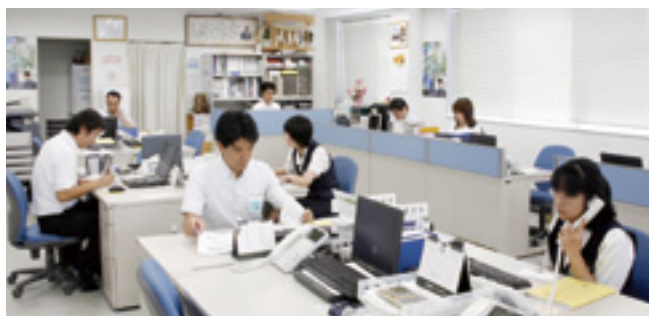
▲手の空いている者が率先して仕事をこなすチームワークの良さが自慢