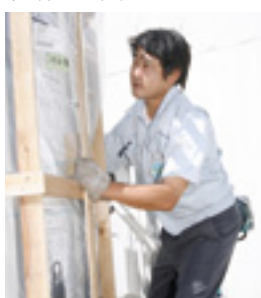
▼プロフェッショナルとしての自覚を常に持ち日々仕事に励む