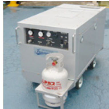
▲先端ツールの交換で、ソフト・ハードおよび多種多様なものの洗浄を可能にした画期的な洗浄システム「イノベンチャー」