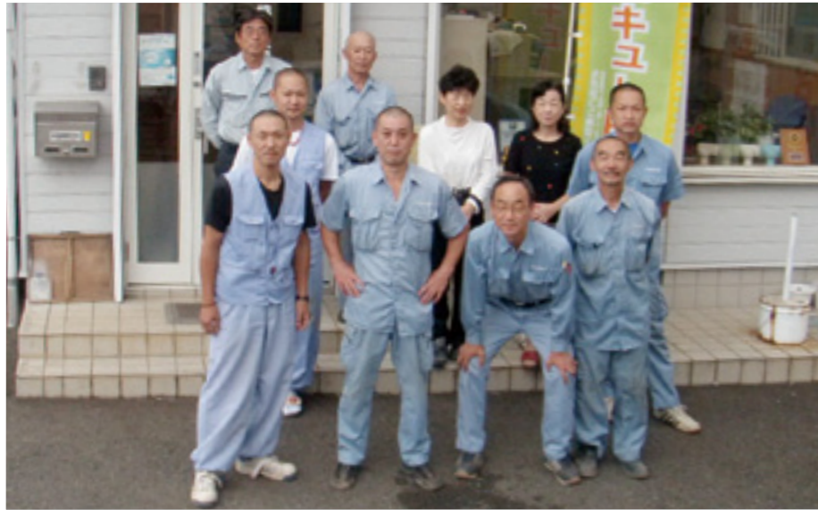
▲先代の残した6つの「サービス訓」を守り、地元を大切に、地域ビジョンに沿った事業を展開中