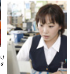
▶整理整頓を常に心がけるなど基本の積み重ねを大切にしてい