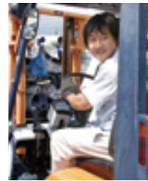
◀地元のお客様は中小の事業所がほとんど。長いお付き合いが続く