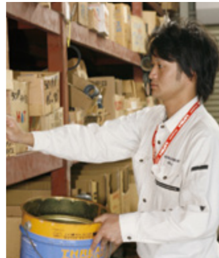
▲子息の義大氏は統括主任として、最新の情報をインターネットを駆使して収集。一方で24時間体制をとっている同社なので、夜中の出勤にも活躍している