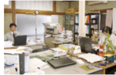
▲管工事、リフォーム工事業が主体の同社