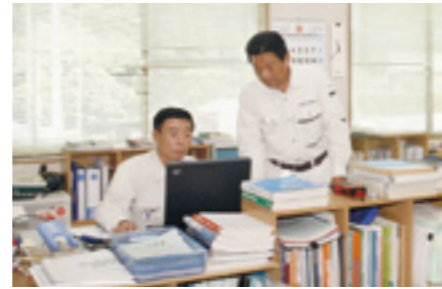
▲綿密な打合せも丁寧な仕事の基礎となる