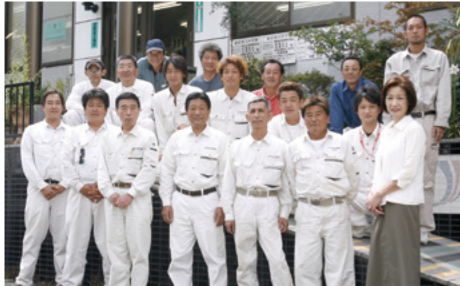
▲「即断即決、即実行」を合言葉に仕事に励む社員皆さん。事務所に貼られた数々の表彰状が歴史を物語る