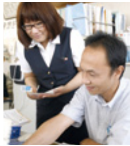
▼仕事にメリハリは大切。打合せもテキパキこなす