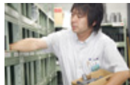
◀平均年齢30代前半。行動力があるのは、若い社員が多い営業所ならではの