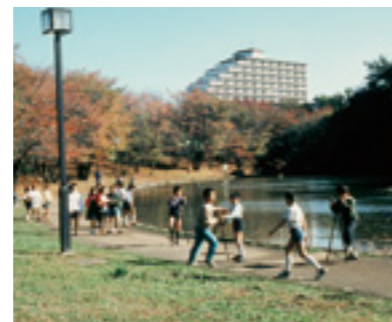
▲せせらぎ公園（仲町台）

弥生時代の集落を復元した「大塚遺跡」と当時の人々の墓を復元した「歳勝土遺跡」のある公園。竪穴住居と高床式倉庫が建ち、周囲の近代的な商業施設やマンションと不思議な風景をつくっている。