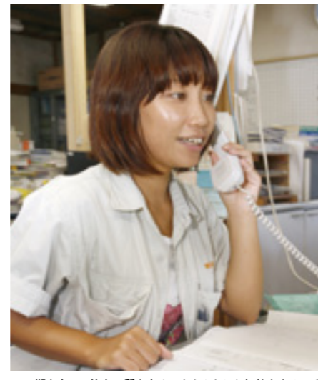
▲工期を守り、仕事の質を高め、きちんとした契約をする。それがお客様から信頼され、長い付き合いをいただける。同社の基本姿勢はブレることがない