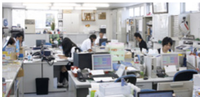
▲老舗の営業所として多忙を極める社内は若い社員が多く活気に溢れている