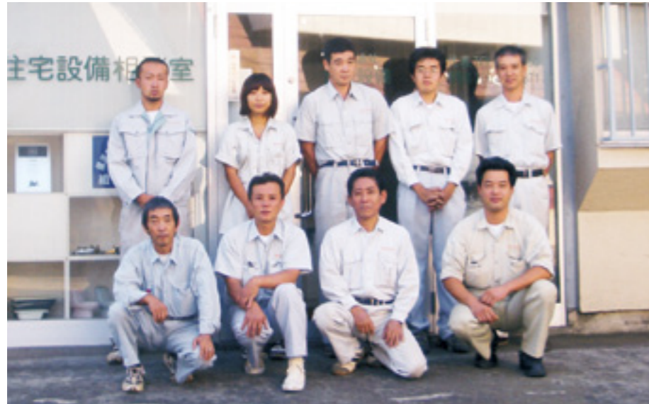
▲「自分に厳しく、お客様の立場に立って仕事をする」を合言葉に仕事に励む社員皆さん