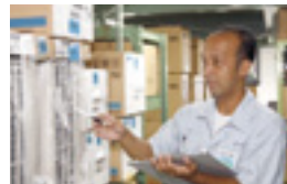
▶日々地道な仕事をコツコツこなすことが大きな成果へ結びつく