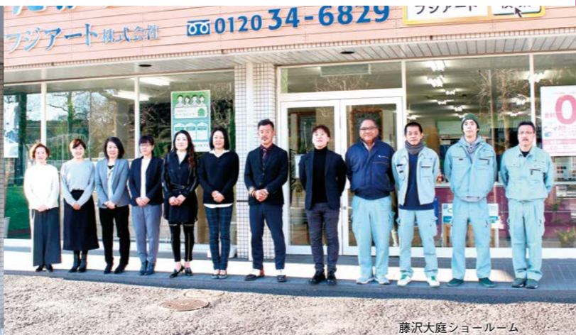
藤沢大庭ショールーム