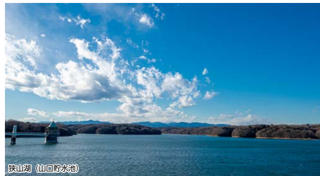
狭山湖 (山口貯水池)

かつて宿場町として栄えた歴史のある入間市は、 今も交通に便利なベッドタウンとして発展しています。