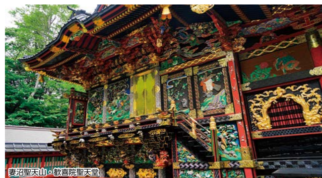
妻沼聖天山・歓喜院聖天堂