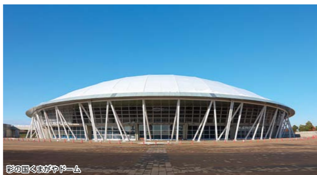
彩の国くまがやドーム