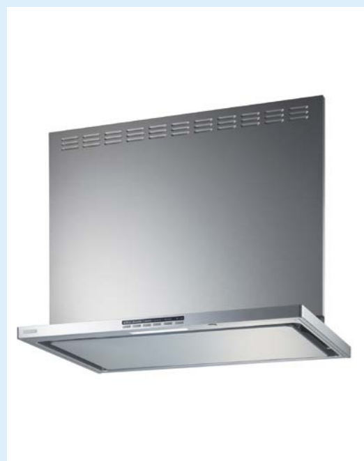
富士工業株式会社・家庭用レンジフードSER-ECC-751/901シリーズ イメージ