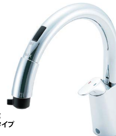
キッチン用タッチレス水栓 ナビッシュ 乾電池式 B5タイプ SF-NB454SX