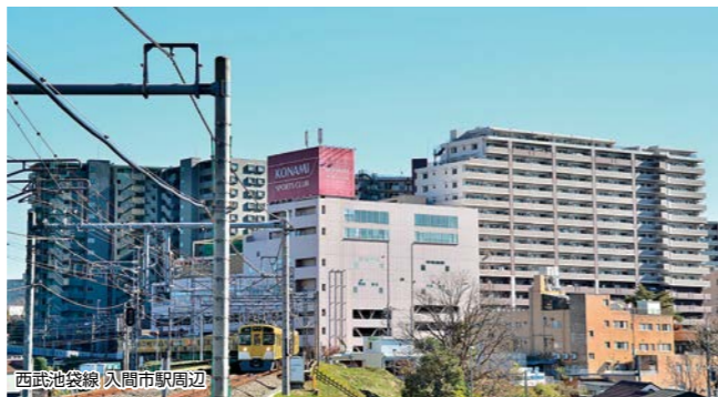
西武池袋線 入間市駅周辺