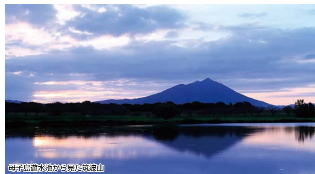
母子島遊水池から見た筑波山