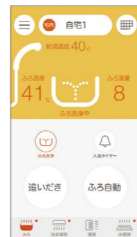
スマートフォンの 操作画面 ※1

お湯はり、追い炊き、床暖房の操作や、入浴者の見まもりなどがスマートフォンでできる