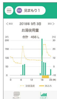
お風呂のライフログ 見まもり画面 ※1※2

スマホで「お風呂そうじ」「お湯はり」、家族の「見まもり」までできる。そんな未来のお風呂の誕生です。