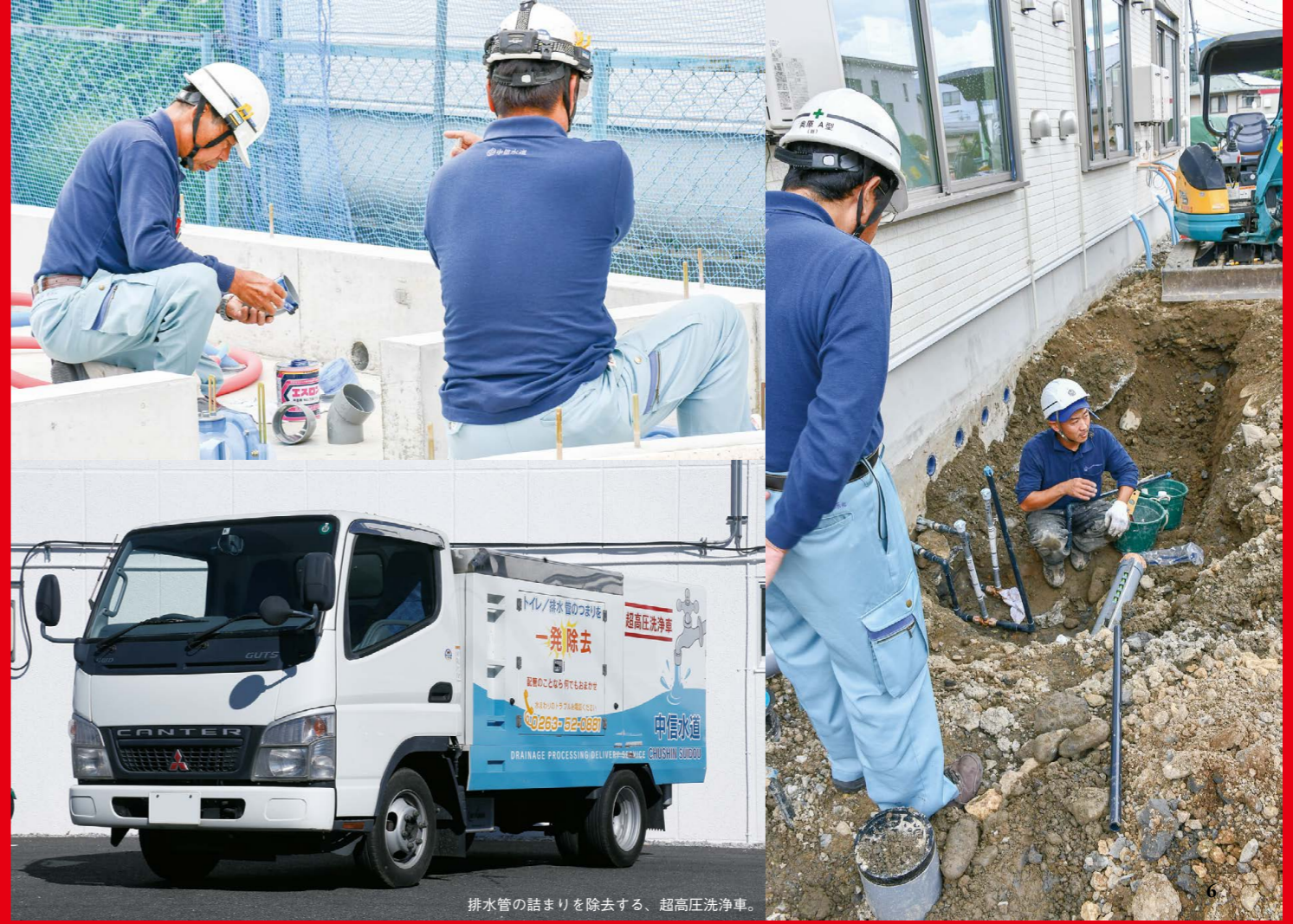
排水管の詰まりを除去する、超高压洗浄車。

株式会社 中信水道 長野県塩尻市大門7番町4番16号 TEL：0263-52-0881 FAX：0263-52-5523