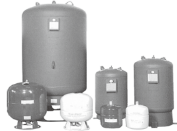
給湯・空調用 密閉式膨張タンク 鋼板製

※らくパネPHJ -200/500 は在庫対応品です。 ※HPJ -1000 は受注生産品です。 ※価格は工場組立出荷の場合です。(現地組立費用等は別途お問い合わせください。) ※本品は消火用補給水槽以外の水槽にも使用できます。