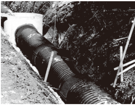
トヨドレンダブル管