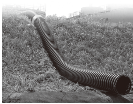
トヨドレンダブルSP管