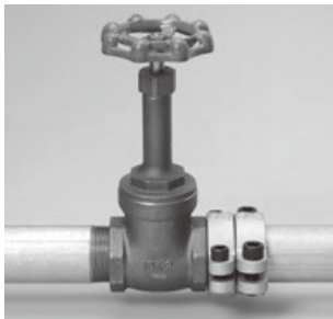
鋼管マルチ継手型

種類 鋼管マルチ継手型・鋼管兼用型・鋼管直管専用型・銅管兼用型・銅管直管専用型・塩ビ管兼用型